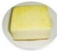
海綿蛋糕 (不含牛奶)