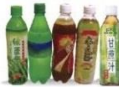
無渣飲料 無渣果汁

※若您為便秘或特殊體質者，鏡檢前的飲食宜更加慎重，可諮詢專業人員，以確保清腸效果。