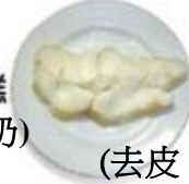
去皮的 魚肉 (去皮、不要帶筋)