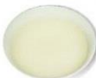
粥湯/肉湯 魚湯/菜湯